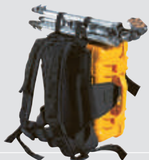
BPS (back pack system)